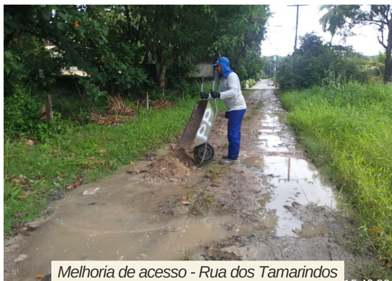
Melhoria de acesso - Rua dos Tamarindos