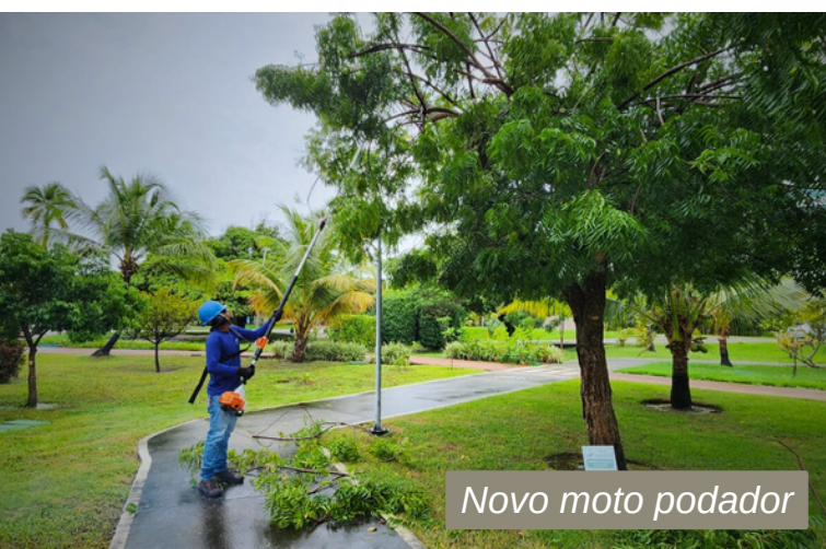
Novo moto podador

entram no cuidado minucioso da AGRP, para manter o padrão paisagístico. E agora, a equipe de campo conta com um novo equipamento, um moto podador de galhos, adquirido neste mês de junho. O instrumento tem alta durabilidade, possui motor a gasolina e alcança uma altura de até 4 metros. A aquisição dá mais agilidade e segurança ao serviço de poda, já que o uso