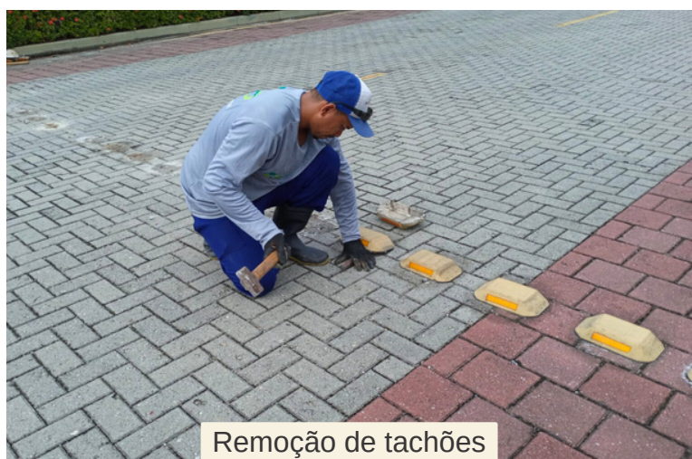
Remoção de tachões