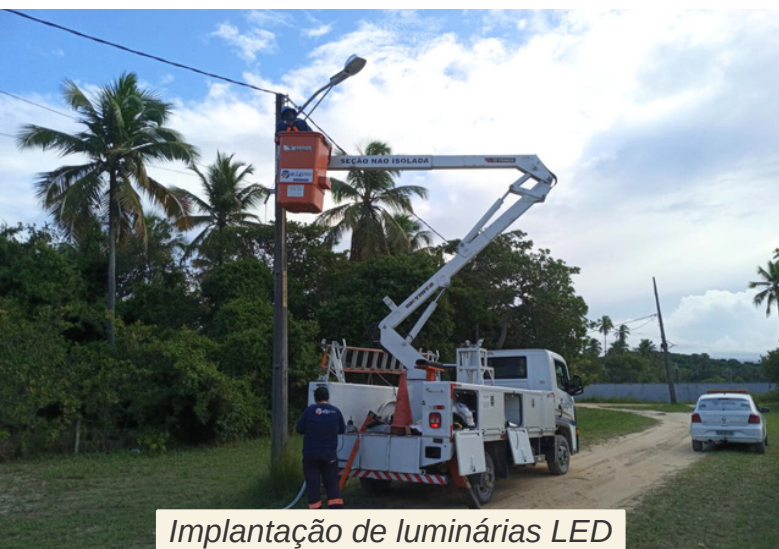
Implantação de luminárias LED

Diariamente, a AGRP faz serviços de manutenção nas áreas públicas do Paiva. Tudo para trazer mais bem-estar, conforto e a beleza paisagística que tanto prezamos aqui no bairro!