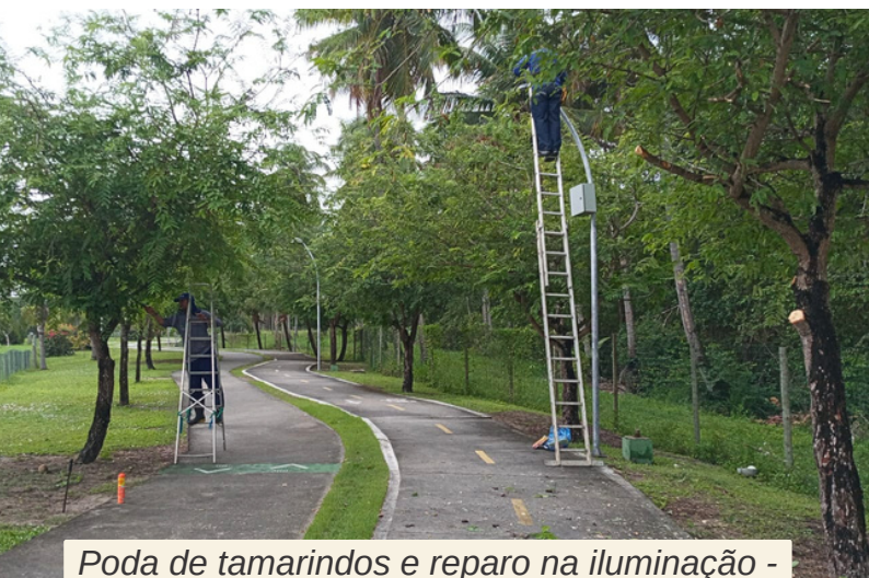
Poda de tamarindos e reparo na iluminação - Parque da Lagoa