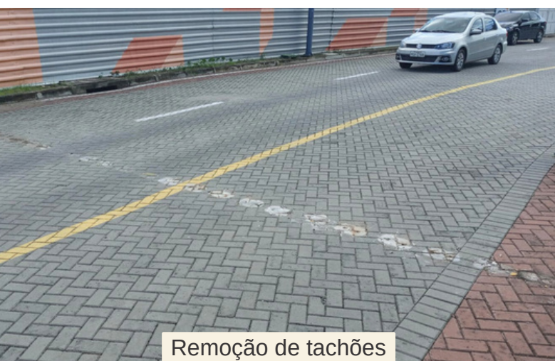
Remoção de tachões