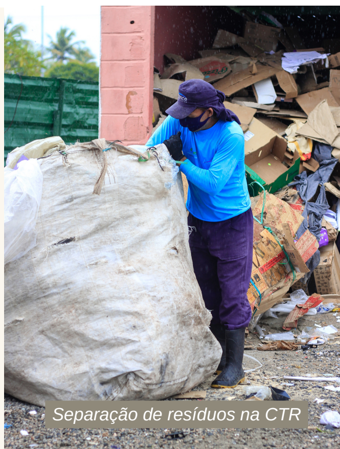
Separação de resíduos na CTR

Confira mais informações sobre estes serviços da AGRP no relatório mensal, disponibilizado na área de Associados do nosso site.