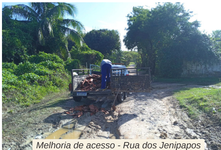
Melhoria de acesso - Rua dos Jenipapos