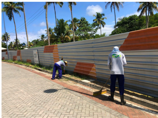
Capinação de canteiros - Rua Vitória Régia

Diariamente, a AGRP faz serviços de manutenção nas áreas públicas do Paiva. Tudo para trazer mais bem-estar, conforto e a beleza paisagística que tanto prezamos aqui no bairro!