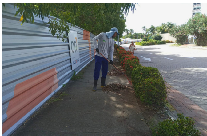
Varrição - Rua Vitória Régia