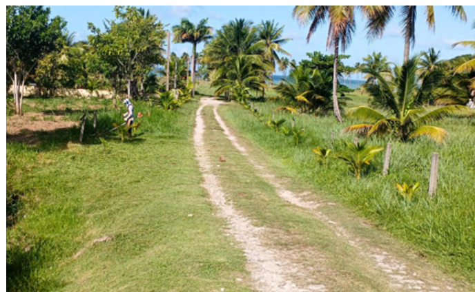
Roçagem - Rua dos Cedros