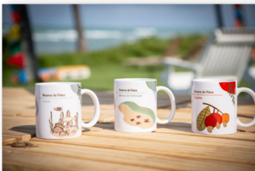
Canecas Reserva do Paiva

Você pode acessar o catálogo através do número (81) 98139.7429.