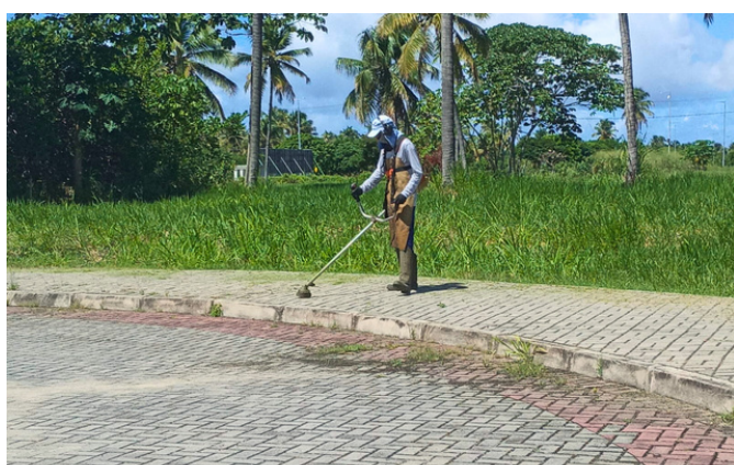
Roçagem - Rua das Laranjeiras