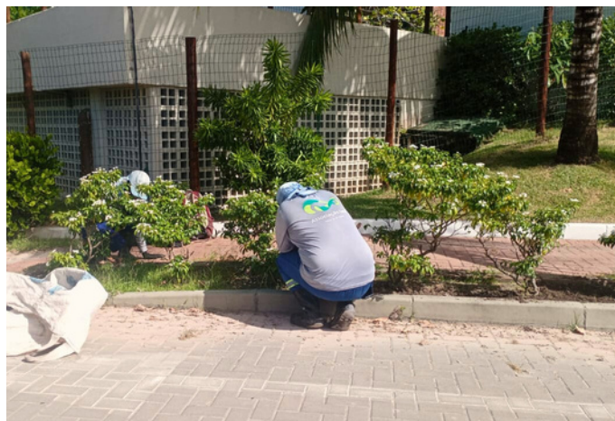
Limpeza de canteiro - Alameda das Mangabas