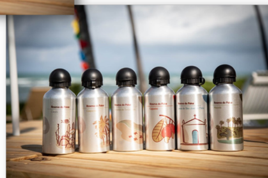
Garrafas Térmicas Reserva do Paiva