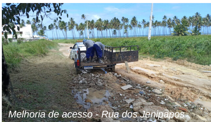
Melhoria de acesso - Rua dos Jenipapos