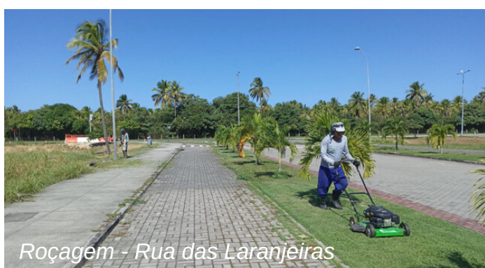
Roçagem - Rua das Laranjeiras