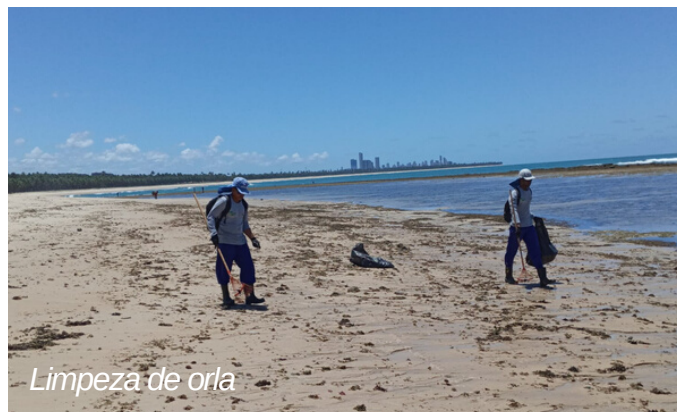
Limpeza de orla