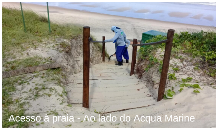
Acesso à praia - Ao lado do Acqua Marine

Diariamente, a AGRP faz serviços de manutenção nas áreas públicas do Paiva. Tudo para trazer mais bem-estar, conforto e a beleza paisagística que tanto prezamos aqui no bairro!