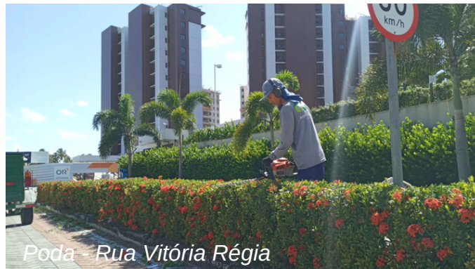
Poda - Rua Vitória Régia