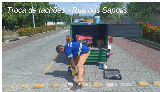
Troca de tachões - Rua dos Sapotis