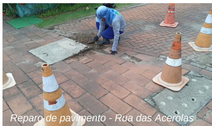
Reparo de pavimento - Rua das Acerolas