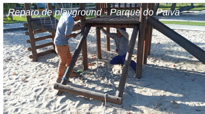
Reparo de playground - Parque do Paiva