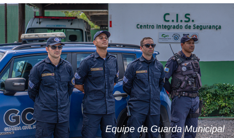
Equipe da Guarda Municipal

Esse modelo de segurança do Paiva garantiu o convênio com o poder público, com o espelhamento e compartilhamento das câmeras das áreas públicas com a central de monitoramento da Secretaria de Defesa Social do Cabo de Santo Agostinho. Outra conquista para a segurança nesse período foi a ativação da Guarda Municipal 24h no bairro, em agosto deste ano, contribuindo ainda mais com a segurança e bem-estar de moradores e visitantes do Paiva.