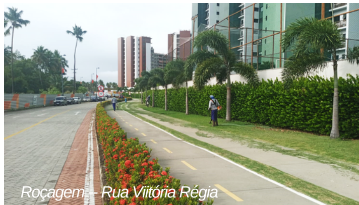
Roçagem - Rua Vitória Régia