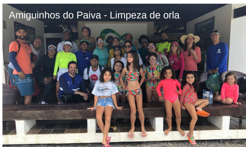
Amiguinhos do Paiva - Limpeza de orla