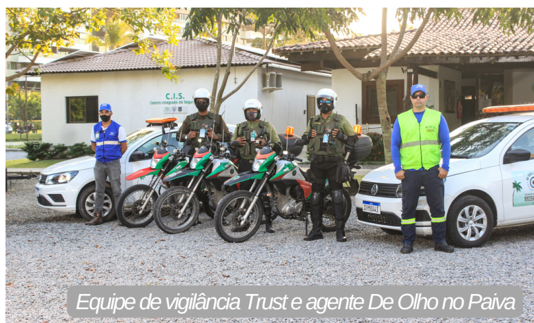
Equipe de vigilância Trust e agente De Olho no Paiva