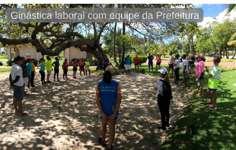
Ginástica laboral com equipe da Prefeitura

Mais duas ações de sucesso com a dedicação e participação de moradores do bairro. O agradecimento da equipe AGRP a todos que estiveram presentes!