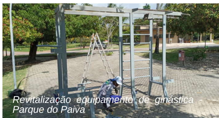
Revitalização equipamento de ginástica - Parque do Paiva