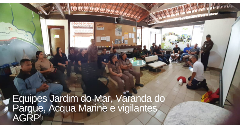
Equipes Jardim do Mar, Varanda do Parque, Acqua Marine e vigilantes AGRP

Agradecemos a todas as turmas participantes pela dedicação nos treinamentos!