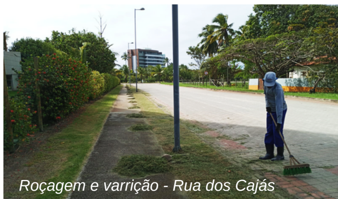
Roçagem e varrição - Rua dos Cajás

Diariamente, a AGRP faz serviços de manutenção nas áreas públicas do Paiva. Tudo para trazer mais bem-estar, conforto e a beleza paisagística que tanto prezamos aqui no bairro!