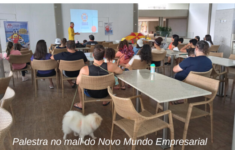
Palestra no mall do Novo Mundo Empresarial

Após a palestra, um momento delicioso de contato com a natureza em família: foram plantadas 20 mudas de Sapoti do Mangue na rota dos coqueiros.