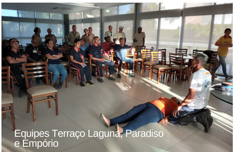
Equipes Terraço Laguna, Paradiso e Empório