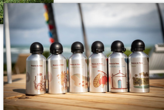
Garrafas Térmicas Reserva do Paiva