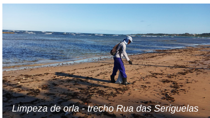
Limpeza de orla - trecho Rua das Seriguelas