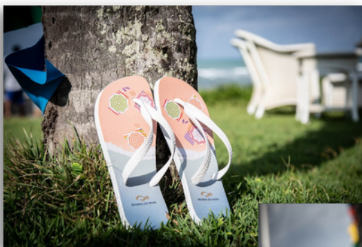
Chinelo Reserva do Paiva

Você pode acessar o catálogo através do número (81) 98139.7429.