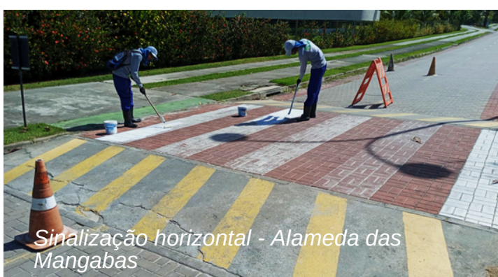
Sinalização horizontal - Alameda das Mangabas