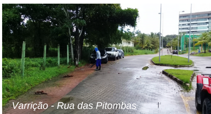
Varrição - Rua das Pitombas