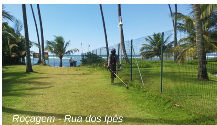
Roçagem - Rua dos Ipês