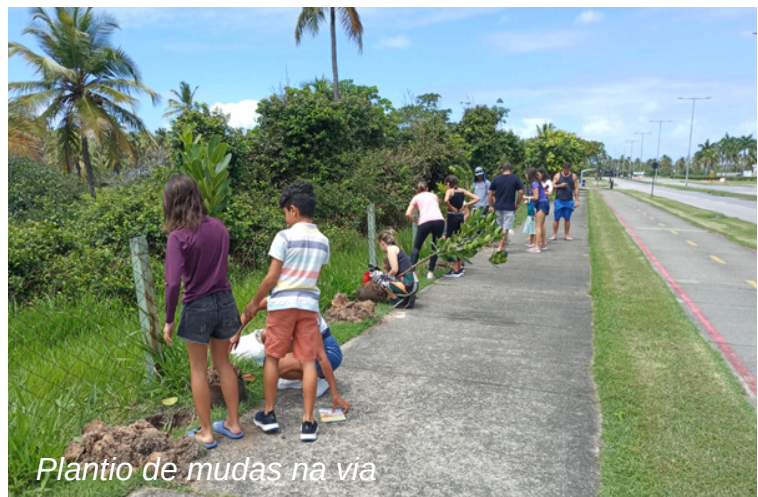
Plantio de mudas na via

No dia 17, em comemoração ao Dia Mundial da Limpeza, o Amiguinhos do Paiva veio com o objetivo de estimular as pautas ambientais nas crianças, com a importância de zelar pela nosso bairro. As crianças foram recebidas com um café da manhã na AGRP, puderam curtir uma ginástica laboral com a equipe da Prefeitura do Cabo de Santo Agostinho e só então ir para a limpeza de orla no Paiva. Para refrescar do calor durante a atividade, suco e água fornecidos pela Coca-Cola, em parceria com a Prefeitura.