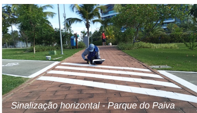
Sinalização horizontal - Parque do Paiva