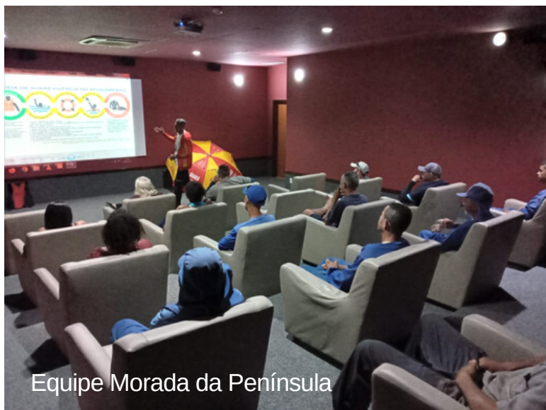
Equipe Morada da Península