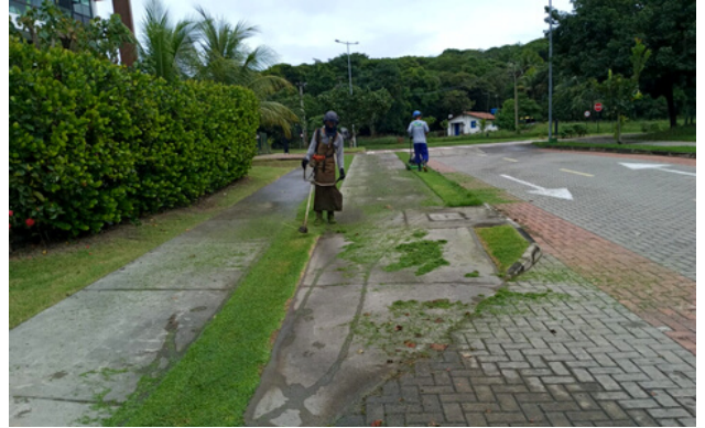
Roçagem Alameda das Mangabas