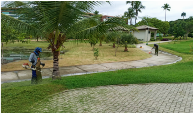
Roçagem Parque do Paiva