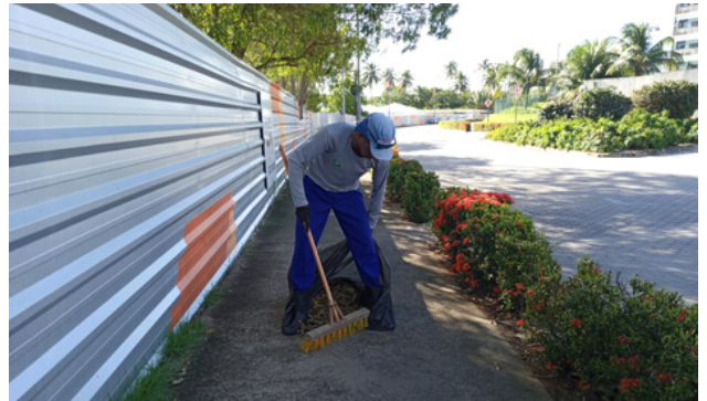
Varição Rua Vitória Régia