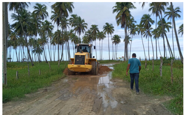
Melhoria de acesso Rua Palma das Princesas