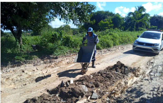
Melhoria de acesso Rua dos Jenipapos