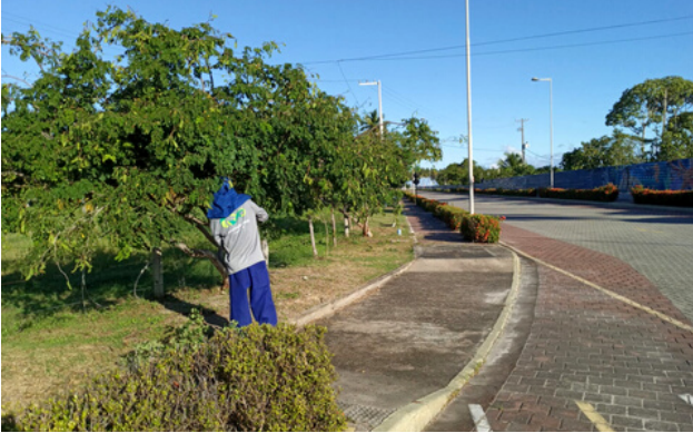
Poda Rua dos Sapotis