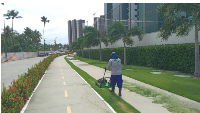
Roçagem Rua Vitória Régia