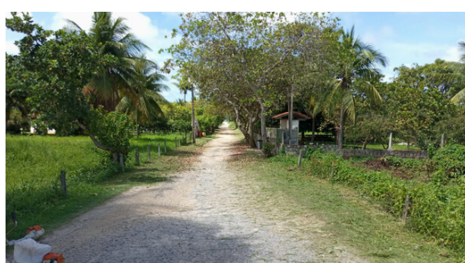
Roçagem Rua dos Jenipapos