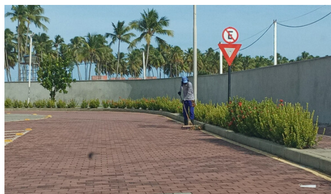
Roçagem Rua dos Sapotis