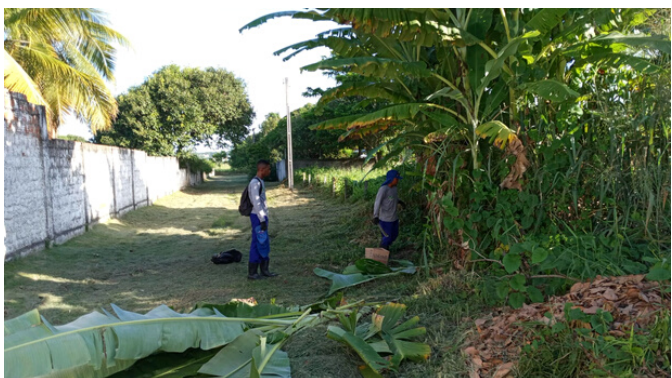
Poda Rua das Acerolas