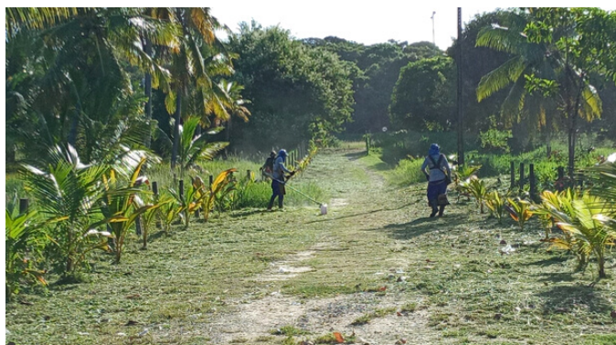
Roçagem Rua dos Cedros