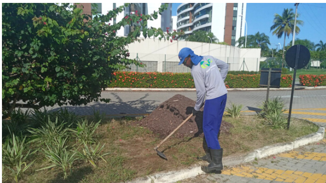
Capinação canteiros Rua Vitória Régia