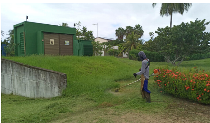
Roçagem Rua Vitória Régia